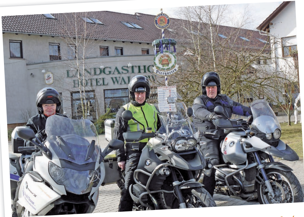
Übernachtet wurde im Hotel Waldow am Ortsrand von Guben