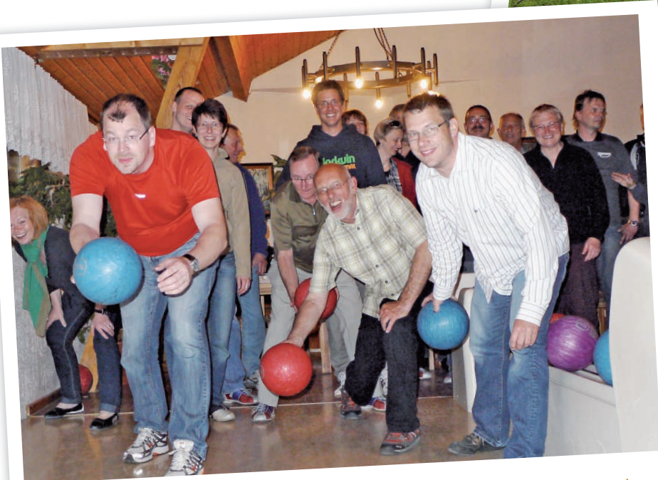
Beim abendlichen Bowlingturnier gab es insgesamt fünf tolle Preise zu gewinnen