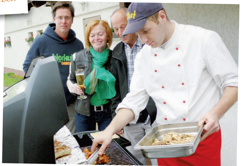
Der Gang zum Grill macht bestimmt auch irgendwie schlank

im Schlaubetal, also nicht weit entfernt von unserem diesjährigen Ziel. Es ging von Berlin aus über Großbeeren, Jühndorf, Groß Schulzendorf, Saalow, Klausdorf, Sperenberg, Horstwalde, Paplitz, Baruth und Golssen direkt in den Spreewald. Über Krausnick-Groß Wasserburg fuhren wir nach Schlepzig. Im Gasthaus Reuse gab es unter anderem ein landestypisches Mittagessen, Pellkartoffeln mit weißem Käse und Leinöl. Noch schnell ein Gruppenfoto – und dann weiter nach Goyatz am Schwielochsee. Das Café am See servierte selbst gemachte Torten.