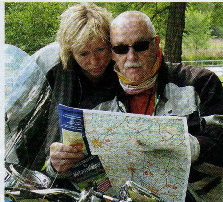
Wo sind wir eigentlich?