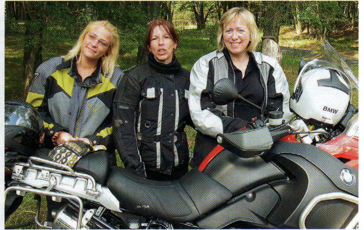
Drei Damen auf Tour