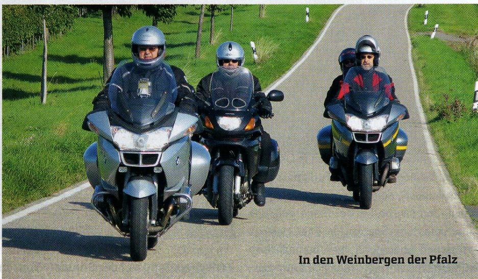
In den Weinbergen der Pfalz