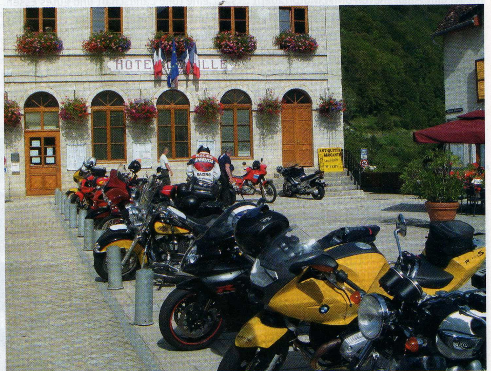
Zwischenstopp auf der Spanien-Tour im beschaulichen Hipolytte

„Unsere Pfingsttour“ (neu im Programm) führt uns in das Fichtelgebirge nach Bad Berneck. Herrliche Kurven, ausgiebige Waldgebiete und gemütliches Beisammensein in „Hartl's Lindenmühle“ sowie im „Gasthof Drei Linden“ mit Frühstücksbüffet, Schwimmbad, Sauna und Hotelbar lassen diese drei Tage viel zu schnell vorüber gehen.