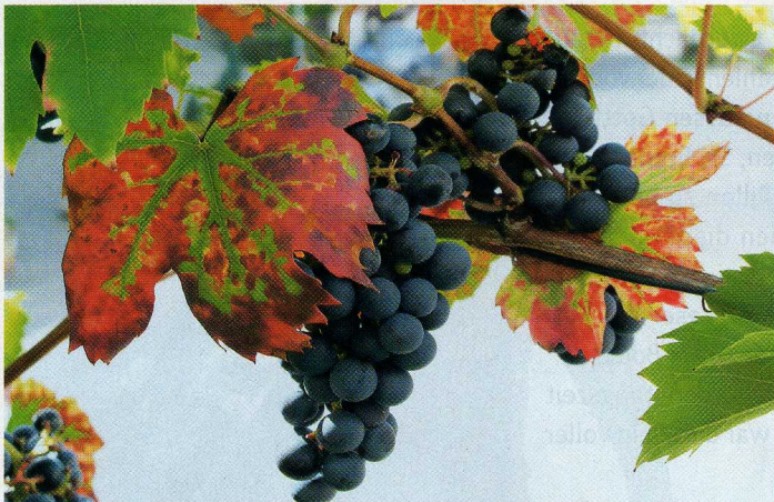
Bei diesem Anblick freut man sich auf die Weinprobe