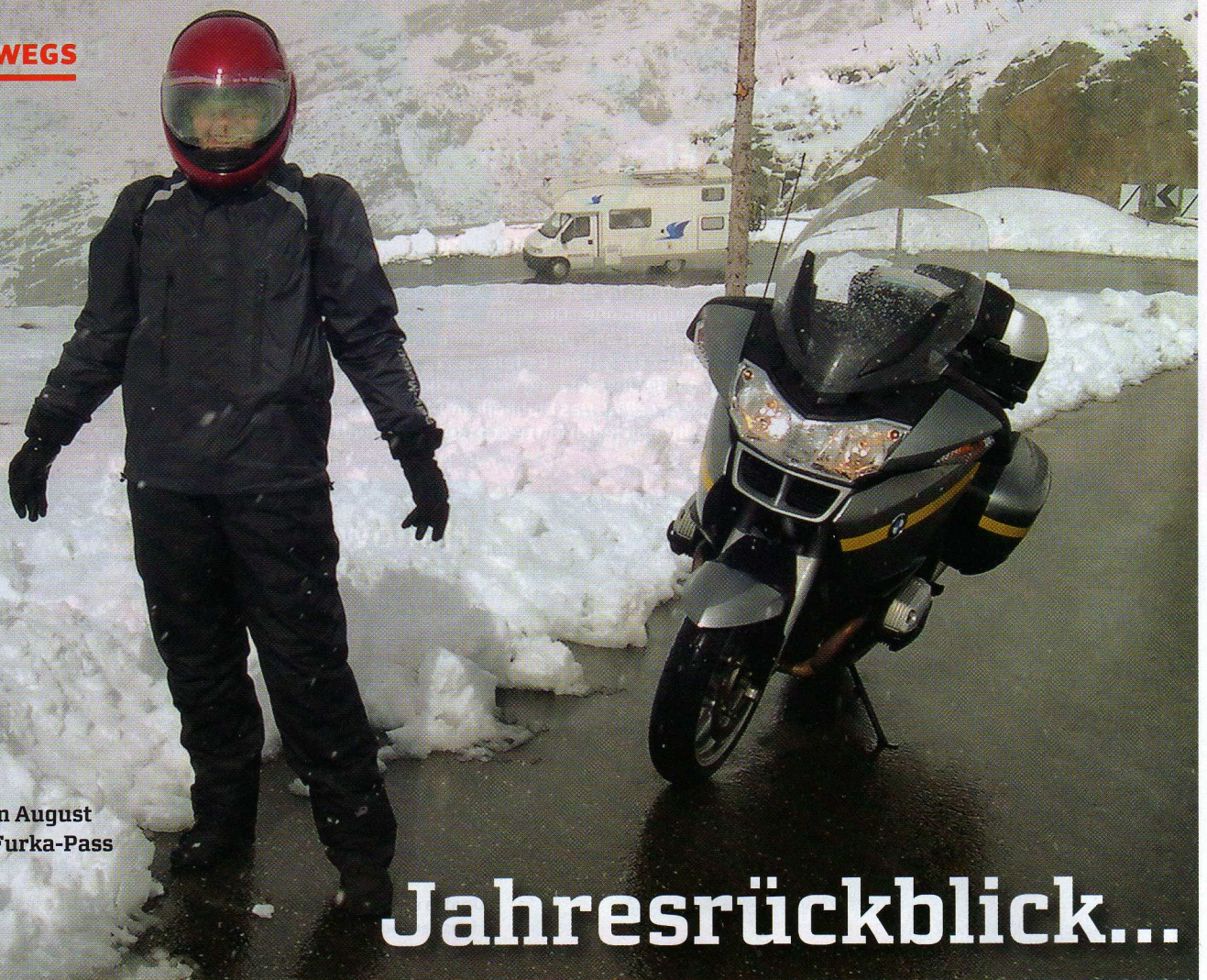
Schnee im August auf dem Furka-Pass