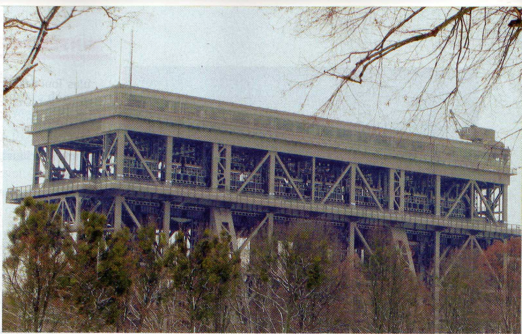
Das 1934 eröffnete Schiffshebewerk in Niederfinow ist ein technisches Denkmal und überbrückt einen Höhenunterschied von 36 m im Zuge des Oder-Havel-Kanals

Es stehen wieder fünf BMW Motorräder von BMW-Motorrad Riller & Schnauck zur Verfügung. Diese werden bei Interesse nach Eingang der Anmeldungen vergeben. Zudem gibt es sage und schreibe 20 Preise , die am Samstagabend beim Grillbuffet verlost werden.