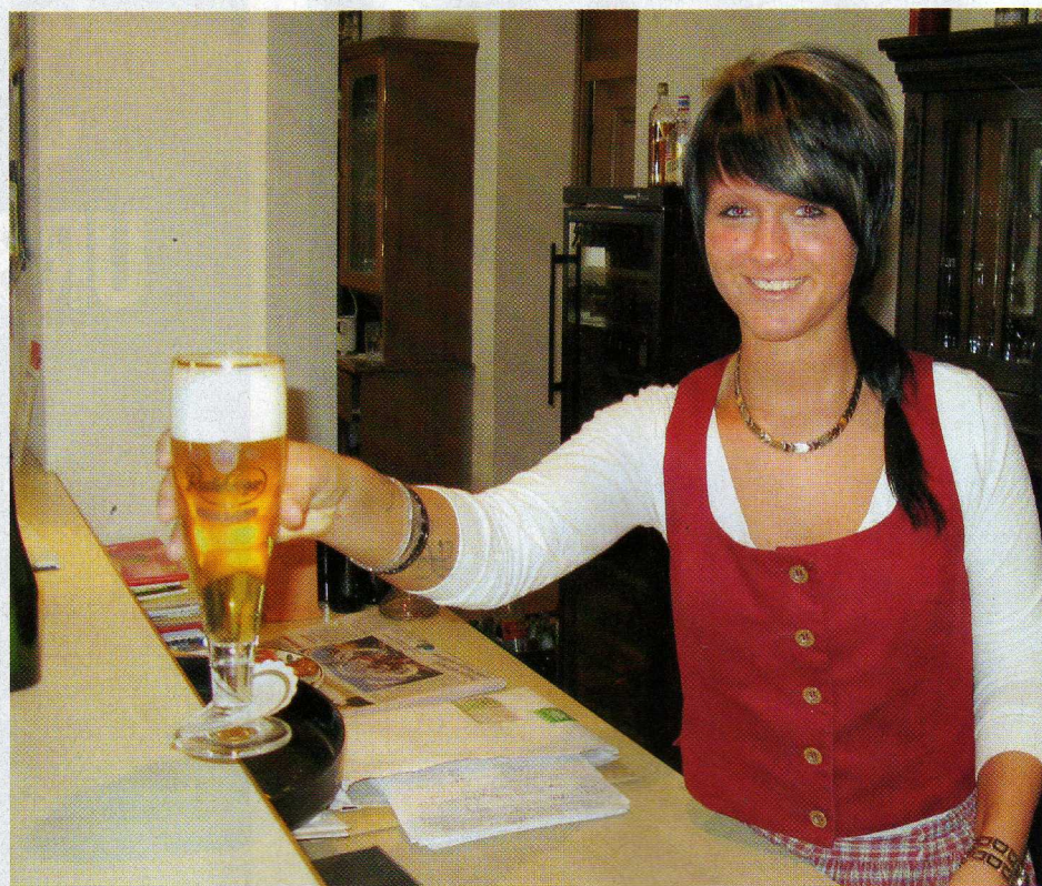
Im Seehotel Huberhof lässt es sich bei so charmanter Bedienung perfekt relaxen

E s ist doch alles eine Frage des Glaubens. Mitte Januar glaubte ich noch daran, wie in der Biker Börse vom Februar Seite 23 beschrieben, dass die nächste Tourvorbereitung mit dem Motorrad gemacht wird. „Pustekuchen“, da macht der lange Winter glatt einen Strich durch die Rechnung. Das hält uns nicht davon ab, unsere 2. Leser-Wochenend-Tour zu planen. Diese wird am Wochenende des 29. und 30. Mai dieses Jahres von Auf Tour... Motorradreisen und der Biker Börse veranstaltet. Diesmal geht es in die Uckermark. Zwischenstopps werden Bad Freienwalde, das Schiffshebewerk in Niederfinow, Angermünde, Criewen im unteren Odertal,