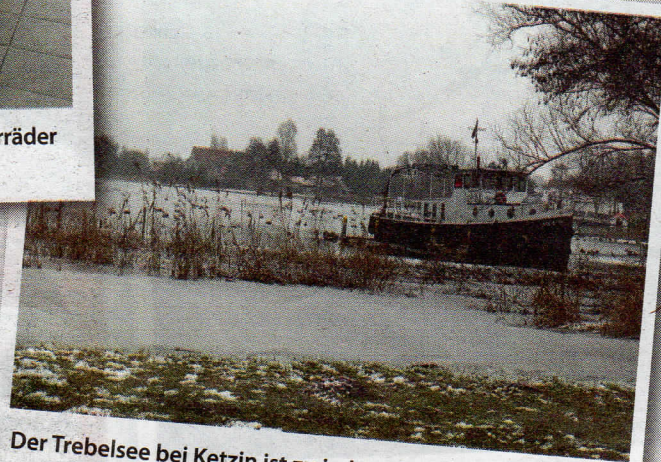
Der Trebbensee bei Ketzin ist zu jeder Jahreszeit malerisch

Über Paretz (hier liegt links der Route der Göttingsee), Uetz, und Nedlitz (nordöstlich befindet sich der Fahrlandersee) geht es durch Potsdam, vorbei am Jungferensee, über die B1 durch Wannsee zurück zu unserem Ausgangsort, der Spinnerbrücke.