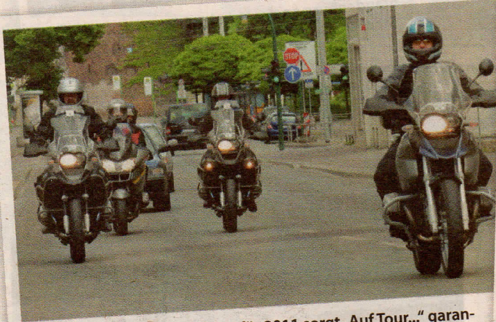
Mit dem ersten Tourvorschlag für 2011 sorgt „Auf Tour...“ garantiert für Frühlingsgefühle