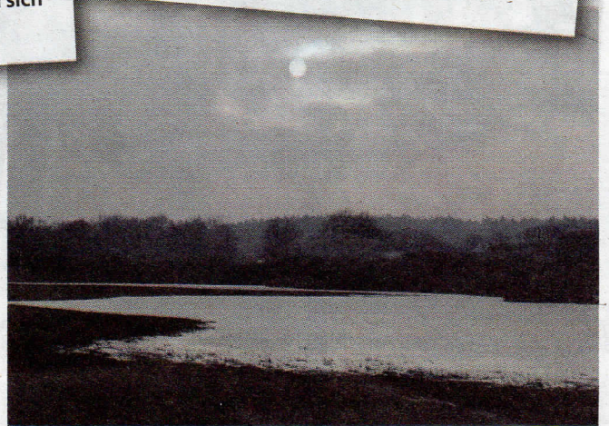
Der Beetzsee erstreckt sich über 22 Kilometer Richtung Nord/Nordost

der als einziger nicht von der Havel durchflossen wird. An seinen Ufern liegen unter anderen die Orte Brandenburg, Mötzow, Butzow, Gortz, Bagow und Päwessin. Gut ausgebaute Straßen mit einigen Kurven bieten bei wenig Verkehr rechten Fahrspaß.