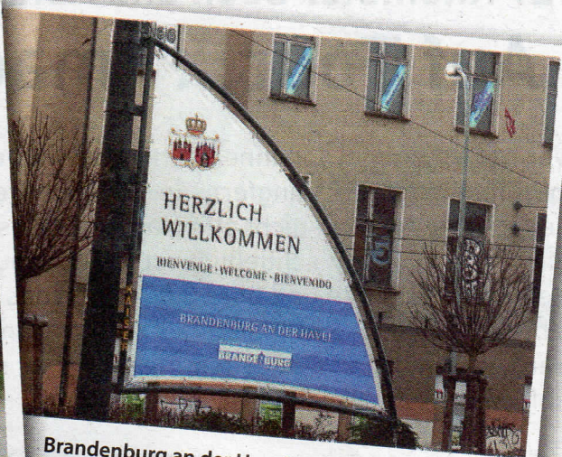
Brandenburg an der Havel gehört zu den ältesten Städten in der Mark

Trebbensee. Die Tour bringt uns weiter über Jeserig nach Brandenburg. Am Ortsausgang biegen wir links Richtung Segelflugplatz ab. Von jetzt an begleitet uns der Beetzsee,