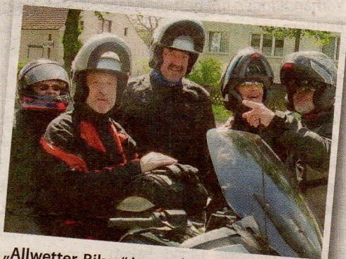
„Allwetter-Biker“ lassen sich die gute Laune von nichts nicht vermiesen

129 Kilometer, drei Stunden Fahrtzeit plus Pausen nach Belieben, eine beschauliche Landschaft mit dem Fluss Havel und vielen Seen liegen hinter uns, gerade der richtige Einstieg für die neue Motorradsaison.