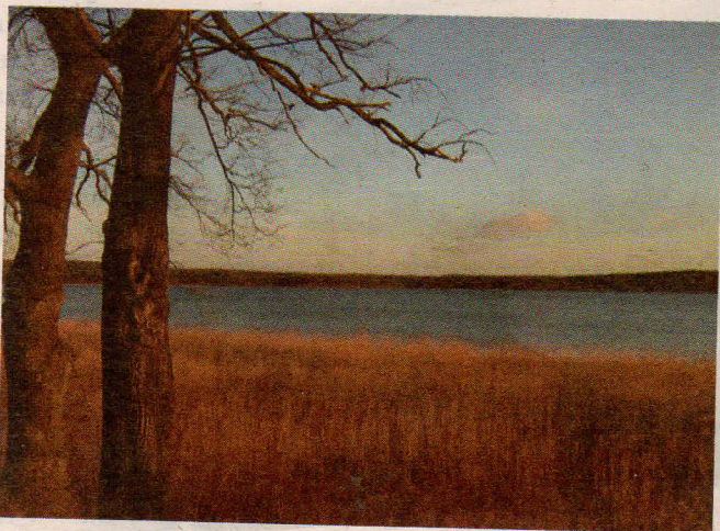
Hinter Potsdam bietet der Schwielowsee herrliche Aussichten

Wir starten an der Spinnerbrücke, fahren durch Wannsee und Potsdam, dann weiter nach Brandenburg. Auf dem Weg dorthin über-