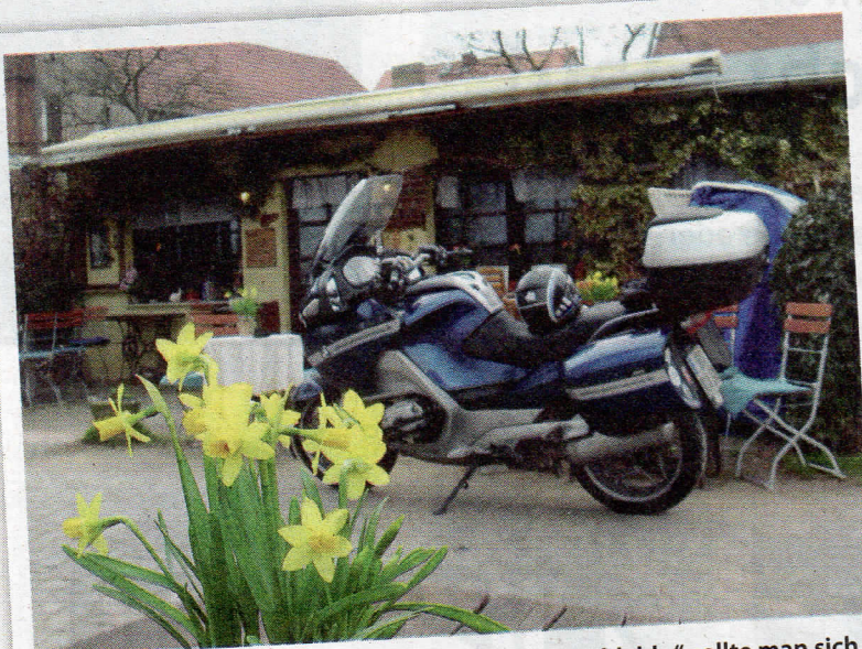
Einen schmackhaften Pausenstopp im „Kuddeldaddeldu“ sollte man sich auf keinen Fall entgehen lassen