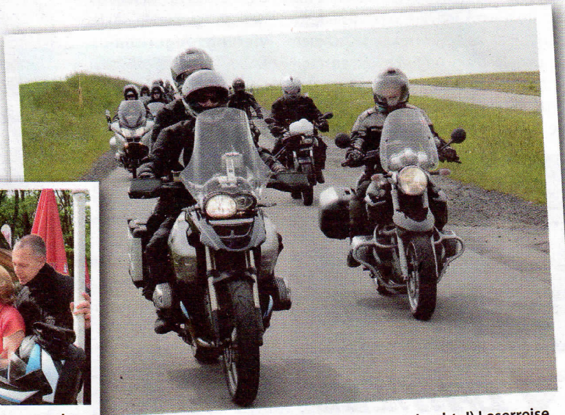
Die beliebte (und jedes Jahr ausgebuchte!) Leserreise geht in Mai 2011 in die dritte Runde