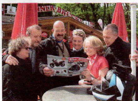
Gestartet wird die Tour wie immer an der Spinnerbrücke

W ir fahren ab Oberkrämer ausschließlich Landstraße, stoppen an der Scheune in Kremmen, durchqueren Sommerfeld und Lindow, bevor wir am Rheinsberger See entlang fahren. Zechlinerhütte, Wesenberg und Mirow liegen auf der Route. Dann geht es zum Luftfahrttechnischem Museum in Rechlin an der Müritz. Wir streifen den Müritz Nationalpark, fahren nach Waren, durch Faulenrost und Malchin und kommen so zu unserem Hotel in Gravelotte am Kummerower See. Die Rückfahrt führt uns mitten durch die Mecklenburgische Seenlandschaft am Rande der Me-