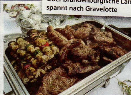
Nach 230 Kilometern Fahrt erwartet das Hotel Gravelotte die Tourgäste mit Grillbuffet und freundlichem Ambiente

Eintritt Luftfahrttechnisches Museum, ein Gutschein über 10 Euro vom ADAC Linthe für ein Motorrad-Fahrsicherheitstraining beim ADAC in Linthe oder Tegel, Reisepreissicherungsschein. Anmeldeschluss ist der 20. Mai 2011. Unser Ziel ist das Hotel Gravelotte am Kummerowsee. Wir fahren am ersten Tag ca. 230, am zweiten ca. 225 Kilometer.