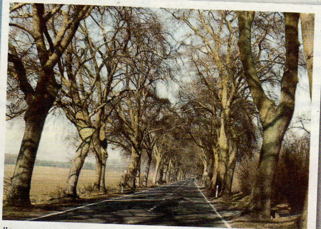
Über brandenburgische Landstraßen fährt man ganz entspannt nach Gravelotte

Die geführte Motorradreise findet am Wochenende vom 28. und 29. Mai 2011 statt. Der Reisebeitrag für Motorrad fahrende Teilnehmer beträgt 139 Euro (im Doppelzimmer/begrenzte Einzelzimmer auf Anfrage zum Aufpreis von 20 Euro möglich), der Reisebeitrag für Sozia/Sozius (im Doppelzimmer) beträgt 99 Euro. Im Preis sind enthalten: geführte Tour in Gruppen zu je maximal 10 Motorrädern plus Tour Guide, Übernachtung/Frühstück, Grillbuffet, Begrüßungsgetränk,