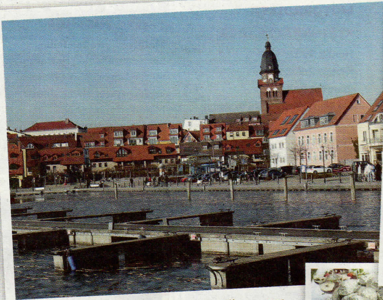
Ein Stopp am Warener Hafen ist eine willkommene kleine Pause zwischendurch

Es stehen insgesamt fünf BMW- bzw. Triumph-Motorräder von Riller & Schnauck Motorrad Berlin zur Verfügung. Diese werden bei Interesse nach Eingang der Anmeldungen vergeben.