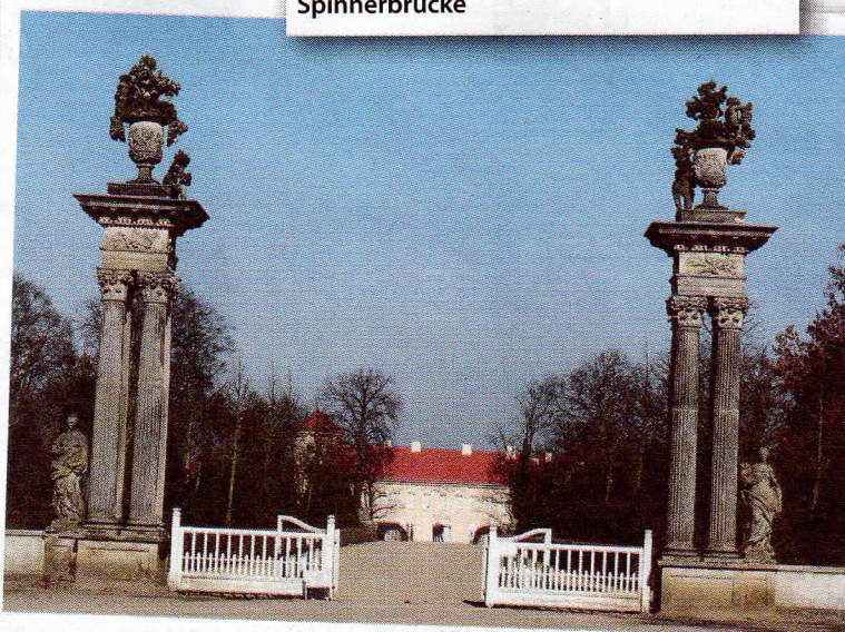
Das Rheinsberger Schloss ist nur eine von vielen sehenswerten Stationen

cklenburgischen Schweiz am Malchiner See entlang, durch Malchow bis nach Röbel an der Müritz. Von hier aus geht es weiter durch Wittstock/Dosse, Herzprung, Alt-Ruppin und Schwante zu Riller & Schnauck Motorrad Berlin in Steglitz, wo bei Kaffee und Kuchen zum Abschluss noch einmal „Aufsitzen“ auf die ausgestellten Motorräder möglich ist.